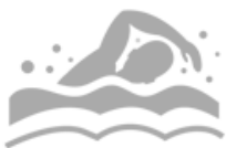
Air or Water