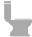
Sharing Toilets, Food, or Drinks