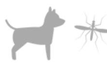
Insects or Pets